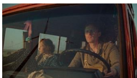
Le Morvan : Semaine du 03 avril

Sicile, 1965. Lia a grandi dans un village rural. Elle est belle, têtue et sait ce qu'elle veut. Lorenzo, fils d'un patron local, tente de la séduire. Lorsqu'elle le rejette, fou de rage, il décide de la prendre de force. Au lieu d'accepter un mariage forcé, Lia le traîne au tribunal. Cet acte va pulvériser les habitudes sociales de son époque et va ouvrir la voie au combat pour les droits des femmes.