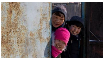
Le Morvan Semaine du 20 mars

Banlieue de Londres. Géorgie 12 ans vit seule depuis la mort de sa mère. Elle se débrouille au quotidien pour éloigner les travailleurs sociaux, raconte qu'elle vit avec un oncle, gagne de l'argent en faisant un trafic de vélo avec son ami Ali. Cet équilibre fonctionne jusqu'à l'arrivée de Jason, un jeune homme qu'elle ne connaît pas et se présente comme étant son père.