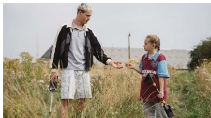
Le Morvan : Semaine du 13 mars

Pour adhérer à Cinémage , envoyez vos nom, prénom, adresse postale et adresse électronique en joignant un chèque de 7€ à l'ordre de Cinémage (3,5€ pour demandeurs d'emploi, étudiants, moins de 25 ans) à l'adresse suivante : Cinémage – BP 20094 – 71206 Le Creusot Cedex